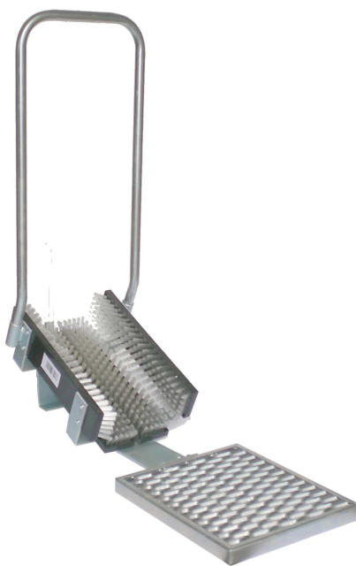
Abb: SWA 400 ohne Handbürste